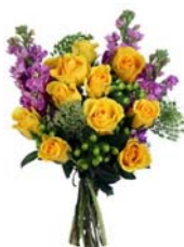
Гуркина Светлана Юрьевна отмечала свой день рождения 4 ФЕВРАЛЯ